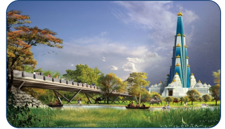
CHANDRODAYA MANDIR-6 MIN DRIVE