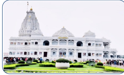
PREM MANDIR- 10 MIN DRIVE