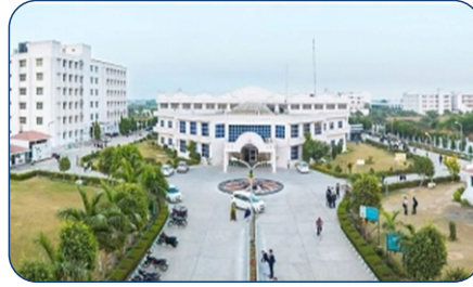
GLA UNIVERSITY- 4 MIN DRIVE