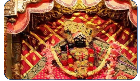
BANKE-BIHARI MANDIR-12 MIN DRIVE