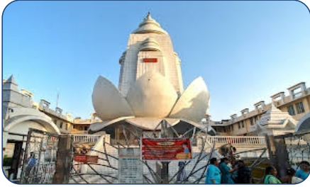
PRIYAKANT JU MANDIR- 5 MIN DRIVE