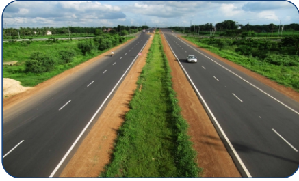
NATIONAL HIGHWAY 3 MIN DRIVE