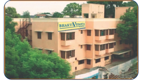
BHAKTI VEDANTA GURUKUL- 2 MIN DRIVE