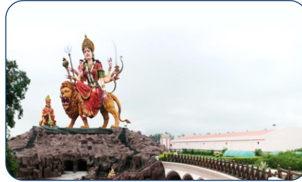
MATA VAISHNO DHAM- 5 MIN DRIVE